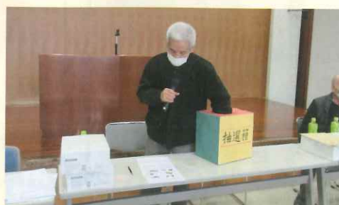
三潁生涯学習センターにて開催

地域班交流会では、当センターの報告や会員皆様の意見交換だけでなく、抽選会やゲームなど地域班長さん方の工夫により楽しい交流ができました。地域班交流会は就業以外の仲間との交流の場です。是非ともご参加ください。