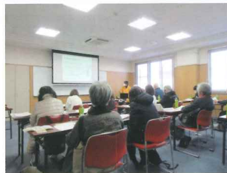
【南校区コミュニティセンター】