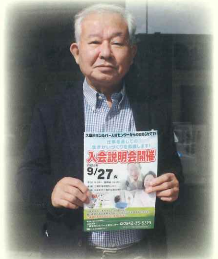
新聞折込チラシを活用し 会員拡大に努めました