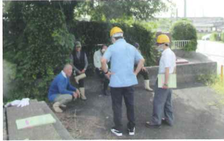
揚水施設管理業務パトロール風景