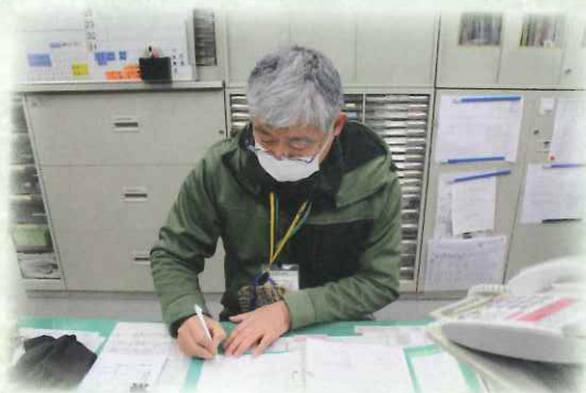
毎日業務日誌を付けています