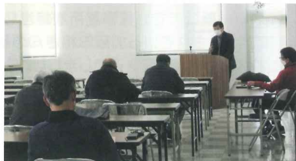
【シルバー人材センター本部】

事前に希望する就業先の就業内容を聞くことで、会員の方々がその施設で就業していくことが出来るのかを考えてもらい、就業後のミスマッチを出来る限り削減したいと考え、事前説明会を開催しました。当日は、丁寧に分かりやすい就業内容の説明を各施設の班長さん及び代表者から伝えて頂きました。今後も事前説明会を開催し、円滑な就業が出来るようにしていきたいと考えています。