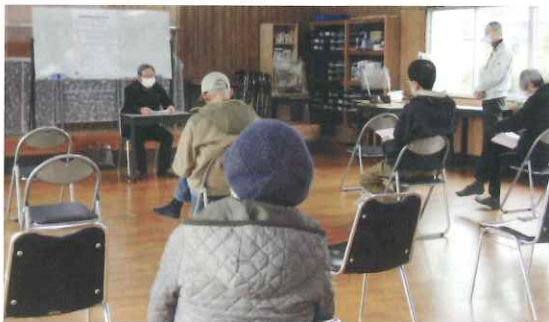
【シルバー人材センター東部出張所】

日時 1月17日(火) 9時30分 場所:シルバー人材センター本部2階研修室 参加人数 87名 1月18日(水) 10時00分 場所:シルバー人材センター東部出張所1階 14時00分 場所:三潁生涯学習センター2階