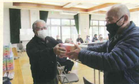
大善寺校区コミュニティセンターにて開催