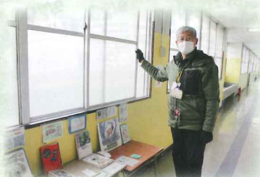
感染症対策の為、毎日校舎内全ての窓の開閉作業をしています