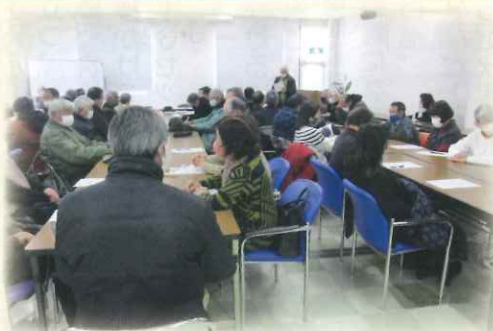
シルバー人材センター本部にて開催