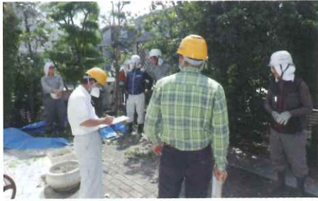
剪定班パトロール風景