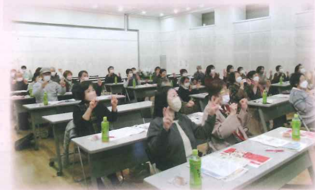
健康教室で指体操♪