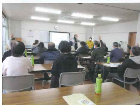
【合川校区コミュニティセンター】