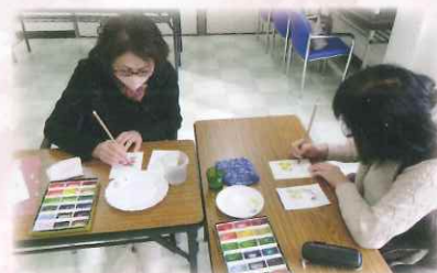
毎月1回様々な催し物を行っています