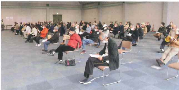
【今年も久留米リサーチパークにて開催しました】

日時 2月17日(金) 14時00分 場所:久留米リサーチパーク1階展示場 参加人数 77名