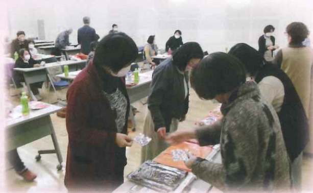
ビンゴゲームで景品選び♪