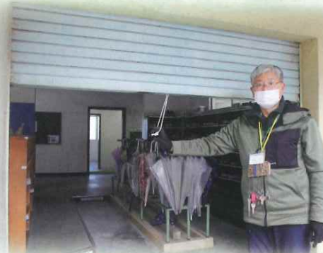
滑りがよくないシャッターもあり、体力を使う場合もあります