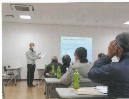
【田主丸校区コミュニティセンター】