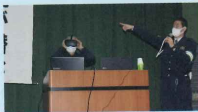
【久留米警察署 小倉総務係長による記念講話】