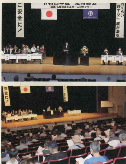
【令和4年度定時総会の様子】

尚、コロナ禍で会場の使用ができない場合又は多数の出席を控えなければならない場合など、変更が生じた場合は、改めてお知らせします。