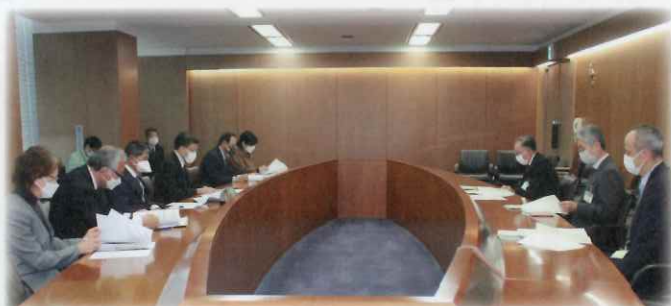
【副市長との懇談風景】