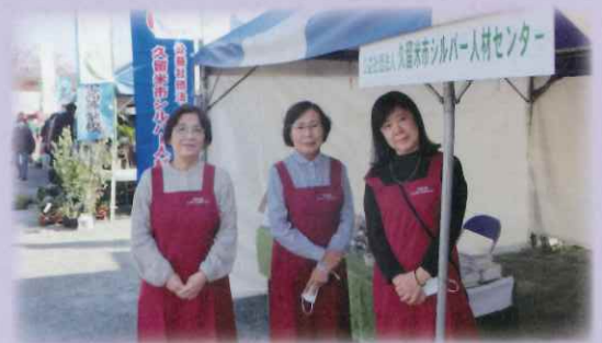
【ふるさとくるめ農業まつりでの活動の様子】

3年ぶりに開催のイベントに参加しました。手作り小物の展示販売を行いながら、会員募集のチラシ配布をしました。天気にも恵まれ、たくさんの来場者で賑わい、完売した小物もありました。これからもイベントに参加し、女性会員拡大に努めていきます。