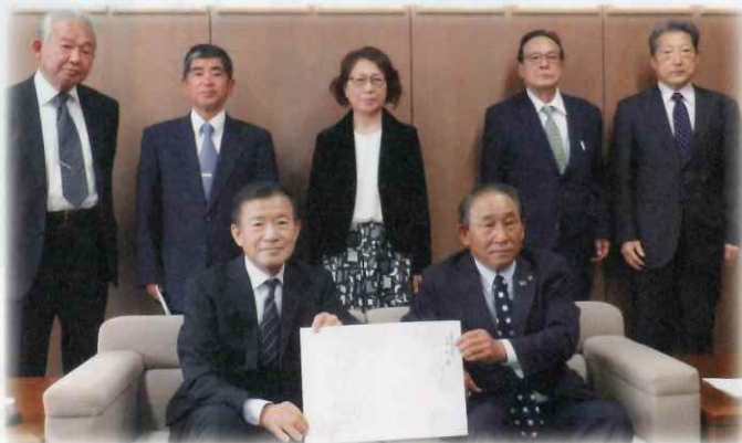
【副議長を囲んで記念撮影】