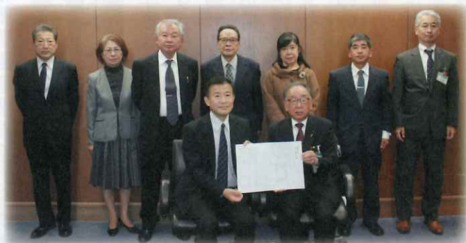
【副市長を囲んで記念撮影】