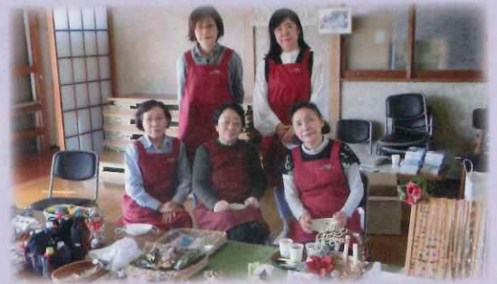
【コスモスフェスティバルでの小物販売の様子】