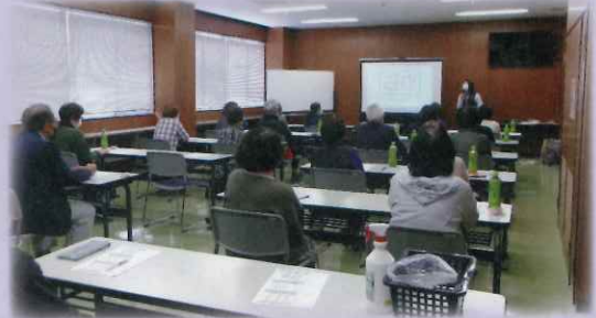
【会員のつどいの様子】

今回も前回好評いただいた久留米ヤクルトさんによる健康教室講座を開きました。免疫とは何かわかりやすく説明があり、免疫を維持するために血流改善の爪もみや身体機能を高める体操を講師の声掛けと一緒に行いました。ビンゴゲームや、最後には嬉しいお土産付きで楽しい時間を過ごしました。