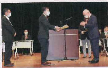
【入賞表彰式の様子】

日頃から会員皆様の安全意識の高揚により、受賞することができました。ありがとうございます。ごさいます。