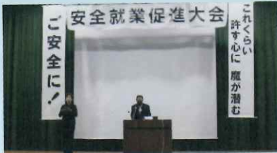
【福島 安全推進委員長あいさつ】

※68名(本部42名、西部地区12名、東部地区14名)が参加。記念講話では、久留米警察署より交通事故事例や道路交通法改正に伴う交通法規等について詳しくお話しいただきました。また、模擬運転装置を使った体験もあり、交通マナーに大変参考になりました。 会員の皆様も安全運転をお願いします。