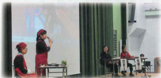
【就業会員紹介の様子】