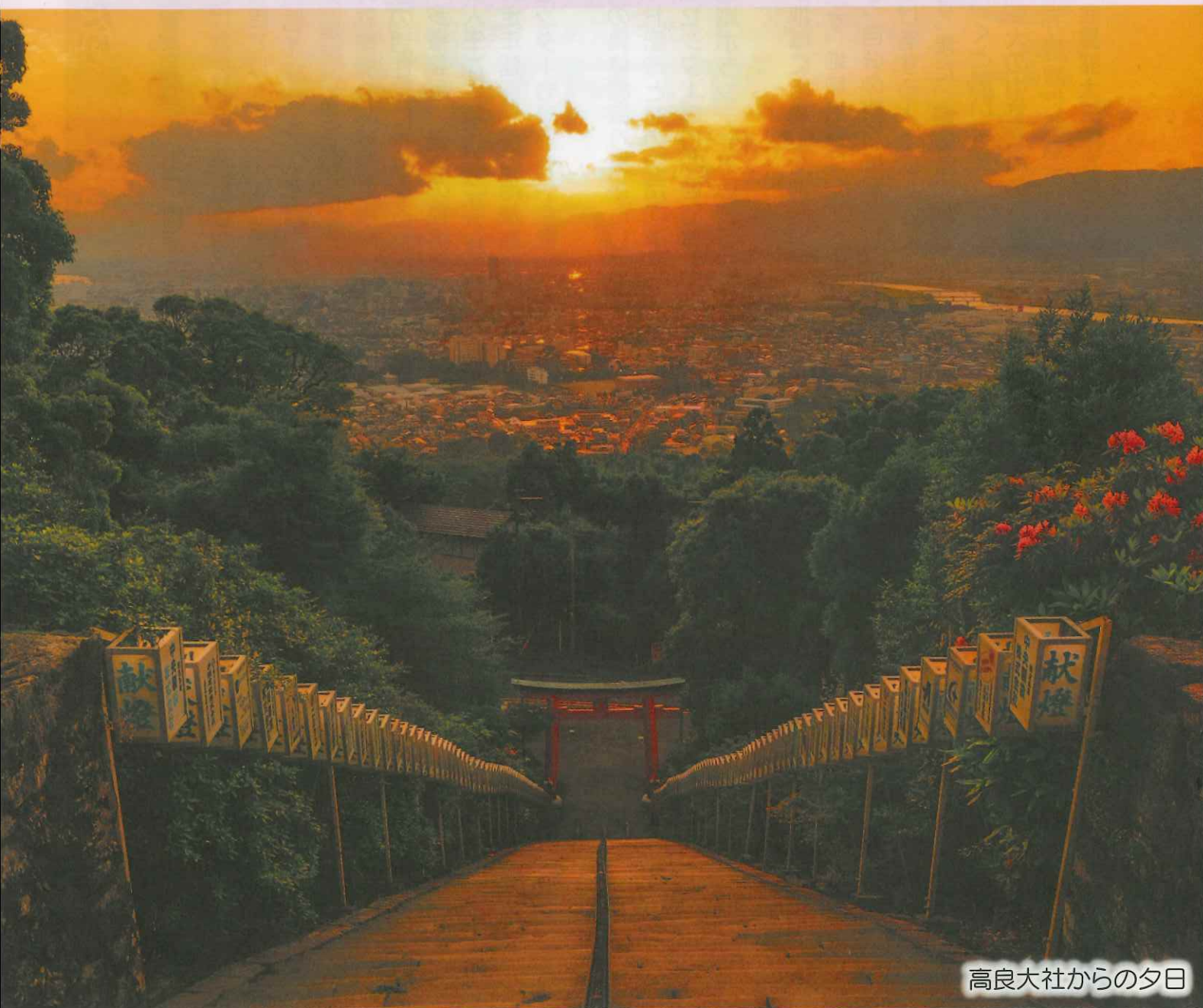
高良大社からの夕日