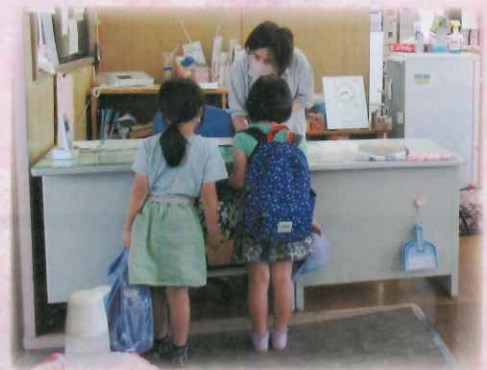
【毎朝の学童保育の様子】

1時間の就業時間でしたが、朝早くから子供たちのために就業いただきありがとうございました。今後も冬休み・春休みと依頼がある予定ですので、是非お知り合いの方に会員登録の声掛け、就業をお願いします！