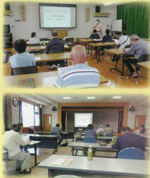
【令和2年度事業説明会風景】

南部地区・北部地区で予定をしていた事業説明会及び入会説明会は、緊急事態宣言が発令中の為、中止となりました。