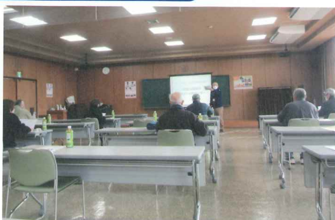
【久留米市総合福祉センターにて】