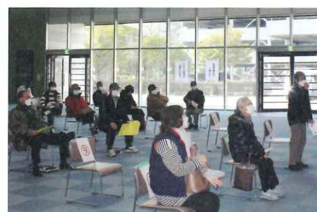
【適正就業抽選会の様子】