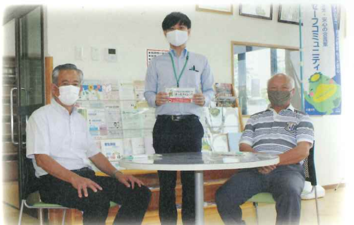
【コミュニティセンターでの普及啓発活動】(2020年)