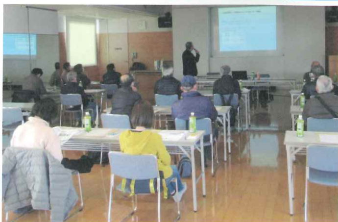
【久留米市民温水プールにて】