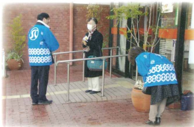
【金融機関前での普及啓発活動】(2019年)