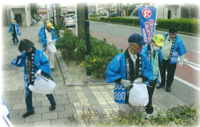
【明治通りでのボランティア清掃活動】(2019年)