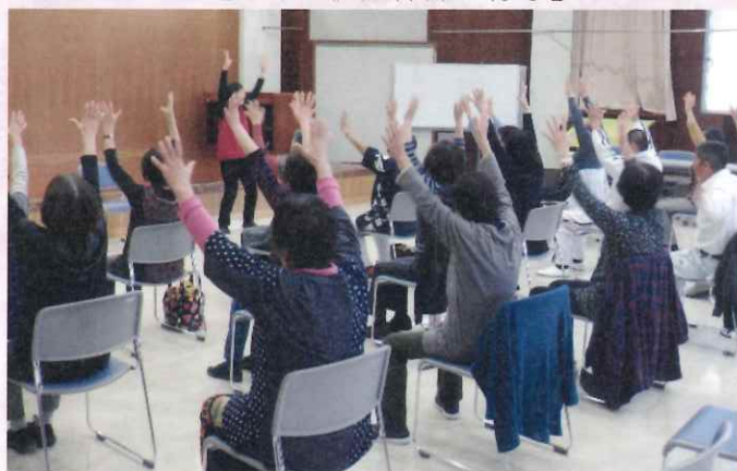
【昨年の健康体操の様子】