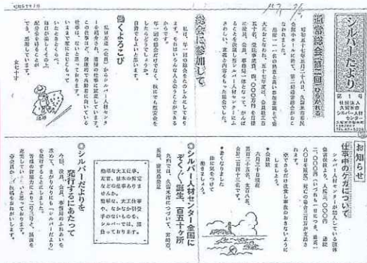
昭和57年7月発行 会報 シルバーだより第1号