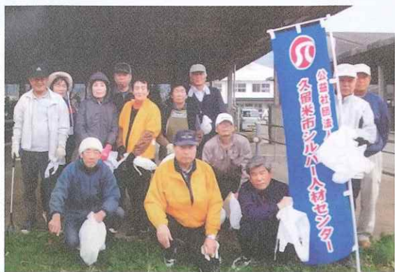
植木市場センター ボランティア活動参加者