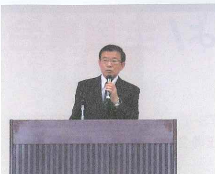
西部会場（5/16理事長挨拶）