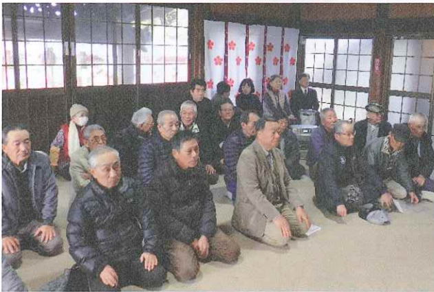
北野天満宮の安全祈願 (1/20)

玉垂宮では出席者一人一人が玉串奉奠(ほうてん)を行い、今年1年間の無事故と会員の皆さんの健康をお祈りさせていただきました。