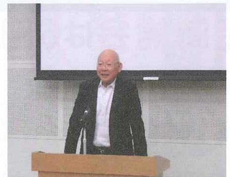
東部会場（5/28安全部長挨拶）