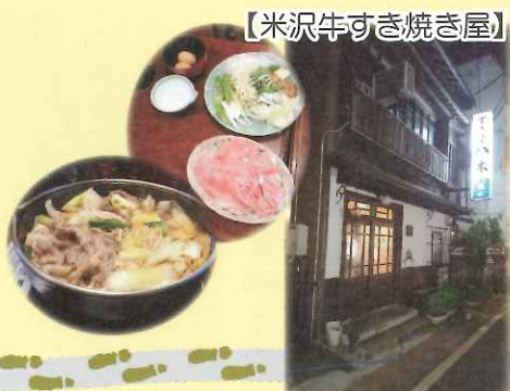
【米沢牛すき焼き屋】