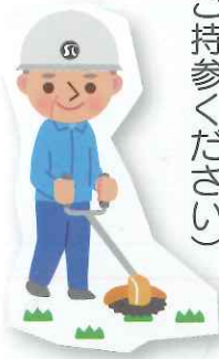
【昨年度の草刈及び剪定講習会】