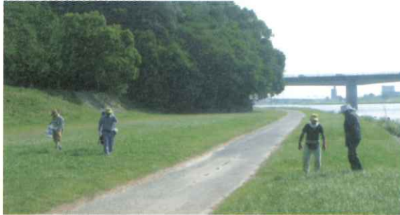
【久留米城下河川敷】