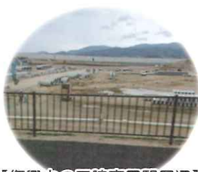
【復興中の三陸高田駅周辺】