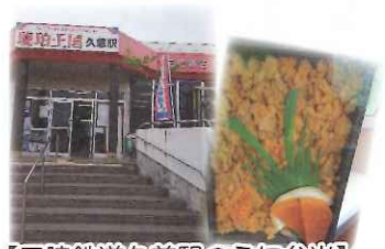
【三陸鉄道久慈駅のうに弁当】