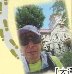
【大通り公園と時計台】