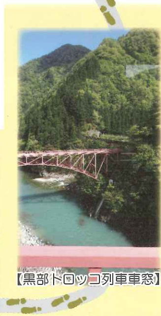
【黒部トッコ列車車窓】