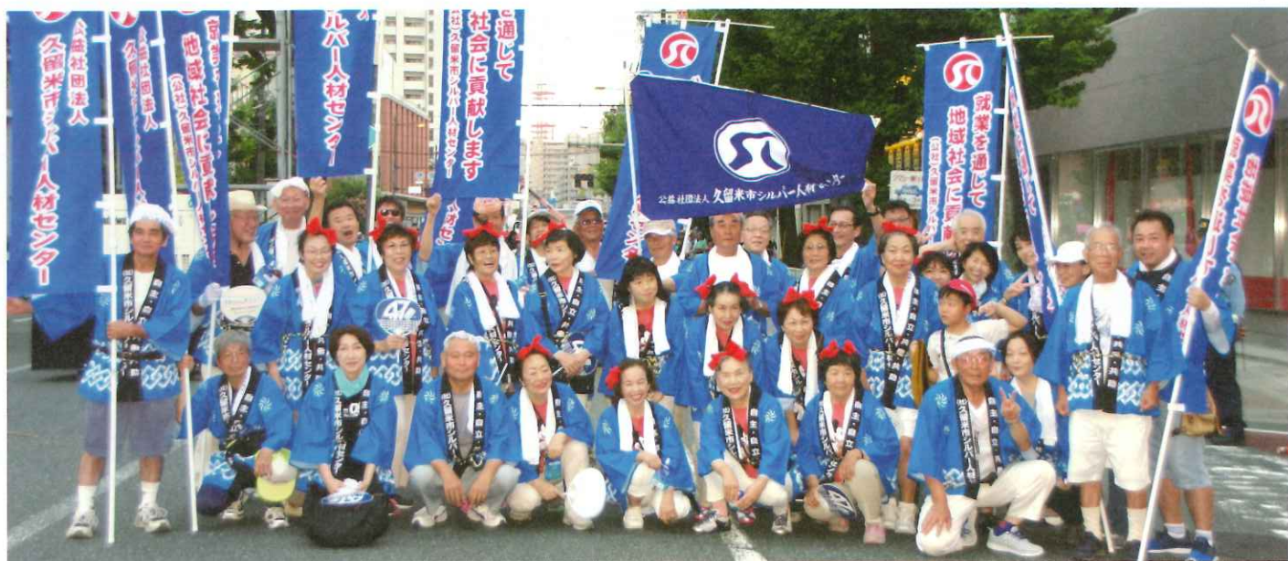
勢揃いした参加者の皆さん。来年もよろしくお祈りします。