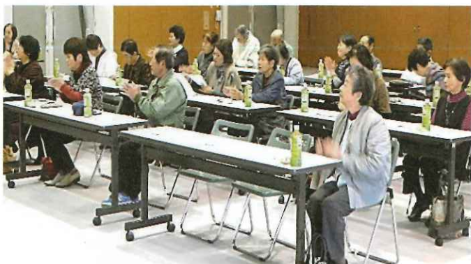
昨年の交流会（西部地区会場）