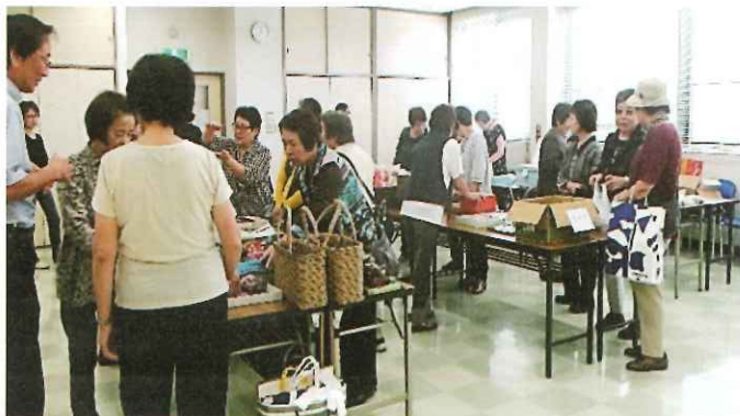
昨年の交流会（本部会場 バザーの風景）

今年は健康体操とビンゴ大会を予定しています。お茶やお菓子を用意していますので、ご近所のお友達にも声を掛けて一緒においでください。