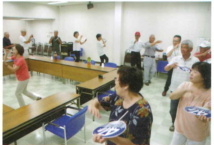
練習風景（とても楽しい練習でした）