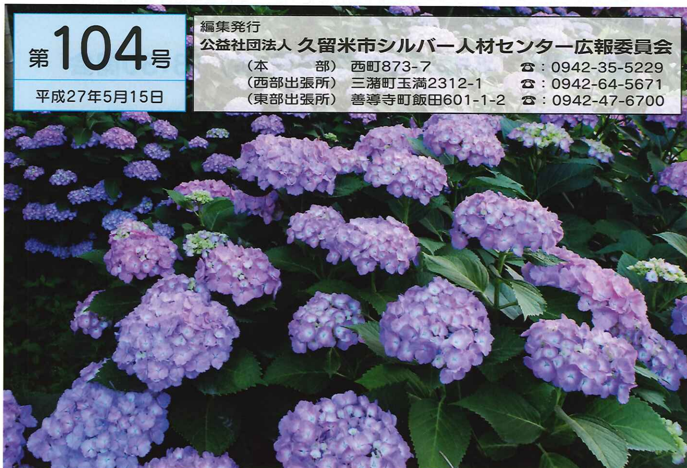
写真:黒木町田代のあじさい(撮影:未安 守)