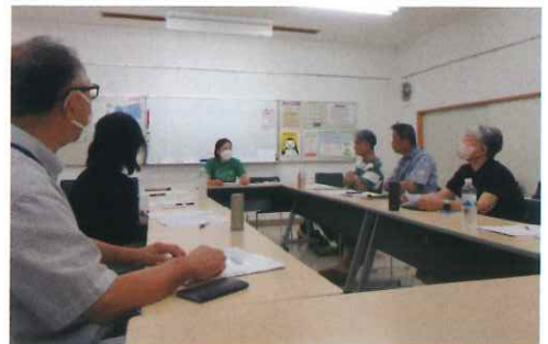
学童サポートスタッフ講習会の様子