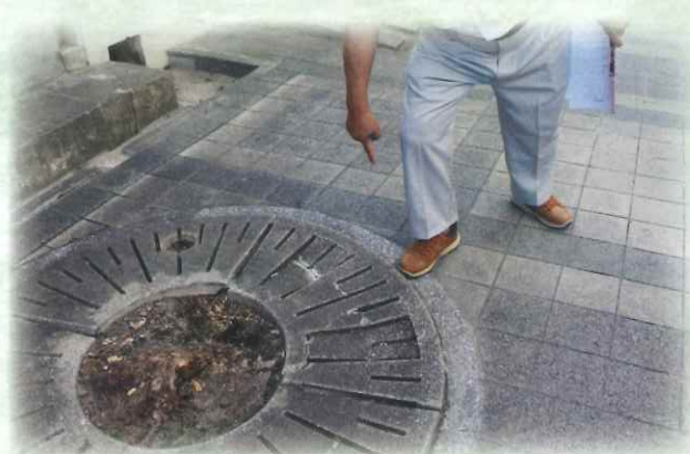
段差が多くある為、注意が必要です