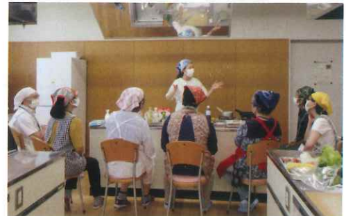
調理補助講習会の様子