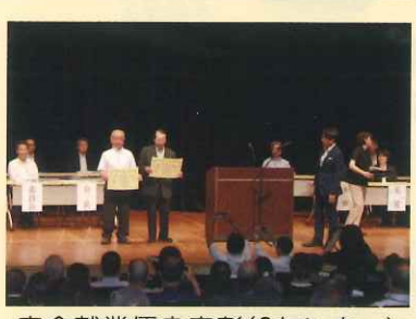
安全就業優良表彰(2センター)