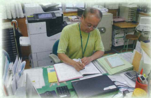
業務日誌をつけています