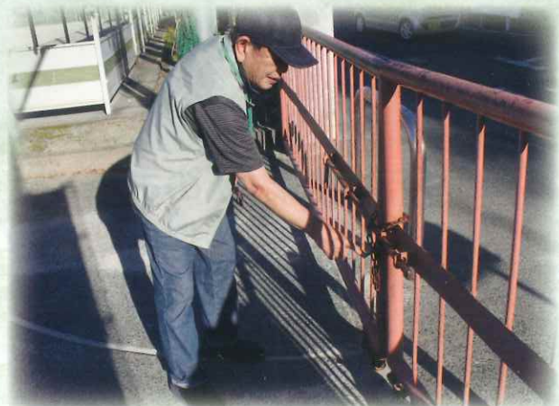
校門、校舎内施設の開閉業務の様子