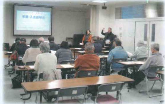
【令和7年度 事業・入会説明会 会場風景】