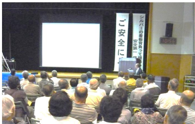
【昨年6月24日 西部地区の安全就業促進大会】

忙しい時期に入りますが、就業予定の確認をお願いし、会員が大会に参加できるよう、ご配慮をお願いします。